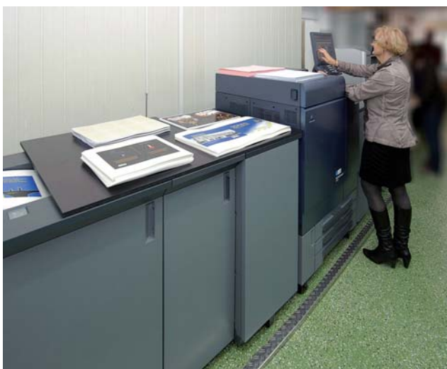
Etwa 326.000 Bögen in Farbe und 56.000 in Schwarzweiß werden monatlich auf den beiden bizhub PRESS-Systemen gedruckt.